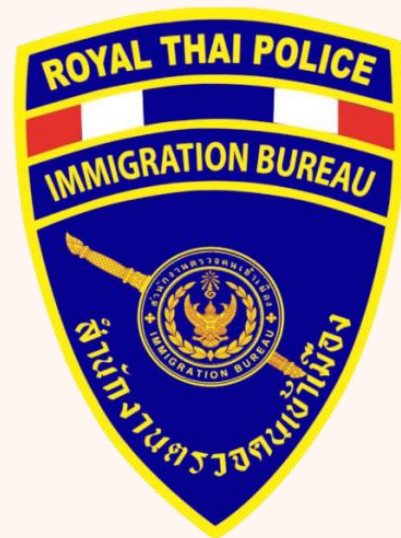
ตำรวจตรวจคนเข้าเมือง