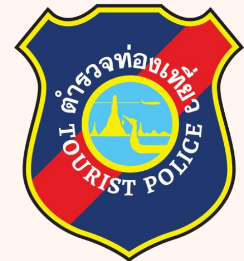
ตำรวจท่องเที่ยว