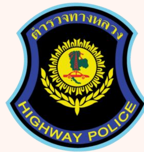
ตำรวจทางหลวง